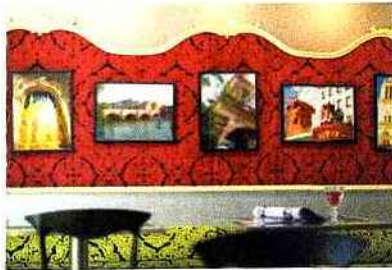
La salle des petits-déjeuners.