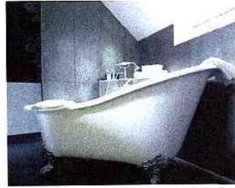
Une salle de bains.